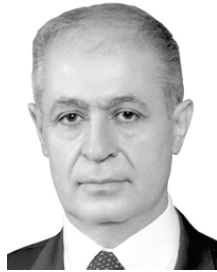
Ahmet Necdet SEZER